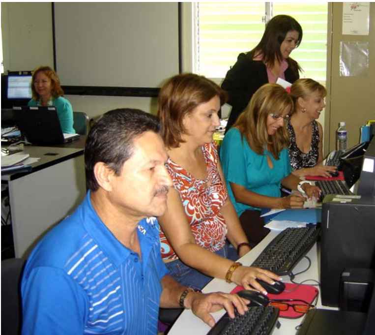
Los maestros demostraron su compromiso con el proceso de Child Count .

Varios maestros del Programa de Educación Especial del Municipio Escolar de Aibonito recibieron una orientación del proceso de Child Count para que estas escuelas puedan cumplir con este proceso de ley. Los maestros del Programa de Educación Especial de las escuelas de Aibonito trabajaron activamente con el sistema durante los días 29 y 30 de septiembre de 2010. Una vez más el Distrito Escolar de Barranquitas que comprende los municipios escolares de Aibonito, Barranquitas y Comerío demuestra su compromiso con los procesos administrativos del Programa de Educación Especial.