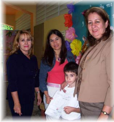
Madre de estudiante, maestra, directora y estudiante de la Escuela Maná Abajo.

Durante el mes de marzo, las escuelas del país entregaron los Informes de Progreso correspondientes a las 30 semanas de clase. Por primera vez, varias escuelas de la isla hicieron uso del Sistema de Información Estudiantil para generar Informes de Evaluación Académica o de Progreso para