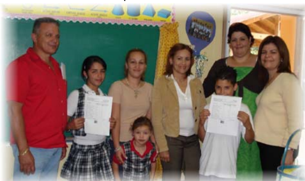
Maestros, padres, directora (foto superior) y estudiantes de la Escuela Sinforoso Aponte mostrando Informe de notas del SIE.

por clase en resumen o en detalle (le permite al maestro tener la lista de cada uno de sus grupos con la suma total de puntos y los por cientos acumulados, ya sea resumidos los periodos académicos o por cada una de las tareas que entró el maestro). Eventualmente, el sistema estará generando otros informes para el beneficio de maestros, estudiantes y todos los componentes de la comunidad escolar. En las demás escuelas del distrito, ya los maestros han utilizado los Informes de Consolidación por Clase para entregar puntuaciones y por cientos a sus compañeros pares, maestros de salón hogar de sus estudiantes. Esperamos que para el mes de mayo, muchos de nuestros maestros se beneficien de este sistema y no tengan que preparar tarjetas o informes de notas para padres y otros informes que usualmente entregan a fin de año porque el SIE los generará automáticamente.