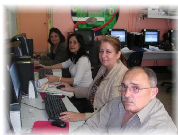
Directores y otro personal se adiestran en SchoolMax .

Por otro lado, los directores de Barranquitas y algunas secretarías y administrativos también recibieron adiestramiento sobre procesos administrativos de SchoolMax , como matrícula de estudiantes y organización escolar. Es importante que todos los maestros de nuestro distrito sean orientados sobre este proceso y que sus dudas sean aclaradas. Para mayor información, puedes comunicarte con nuestro CITeD.