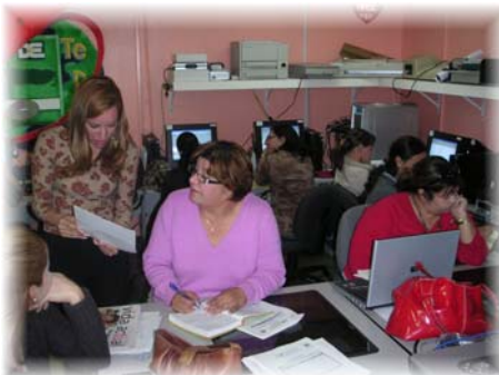
Maestros enlace de las escuelas de Barranquitas recibiendo adiestramiento.

Durante el mes de marzo, maestros de cada una de las escuelas de Barranquitas se adiestraron en el uso y manejo del programado SchoolMax . El propósito de este adiestramiento fue capacitarse en el área del Registro Escolar del Maestro para servir de apoyo a sus compañeros pares.