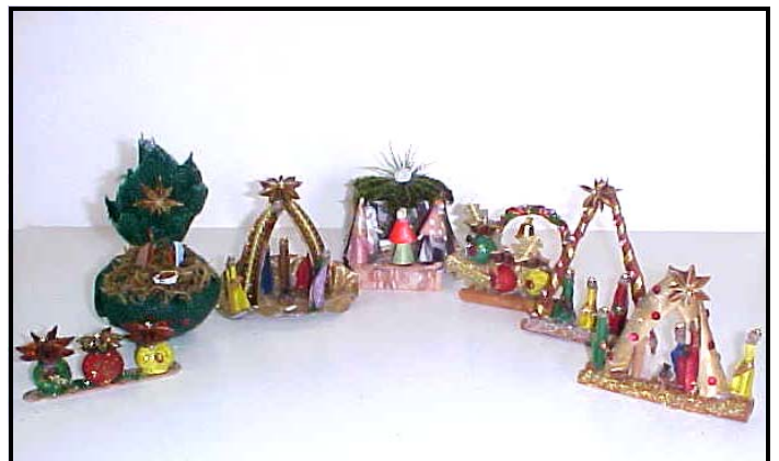
Algunos de los adornos preparados en la Escuela Stephen S. Huse.