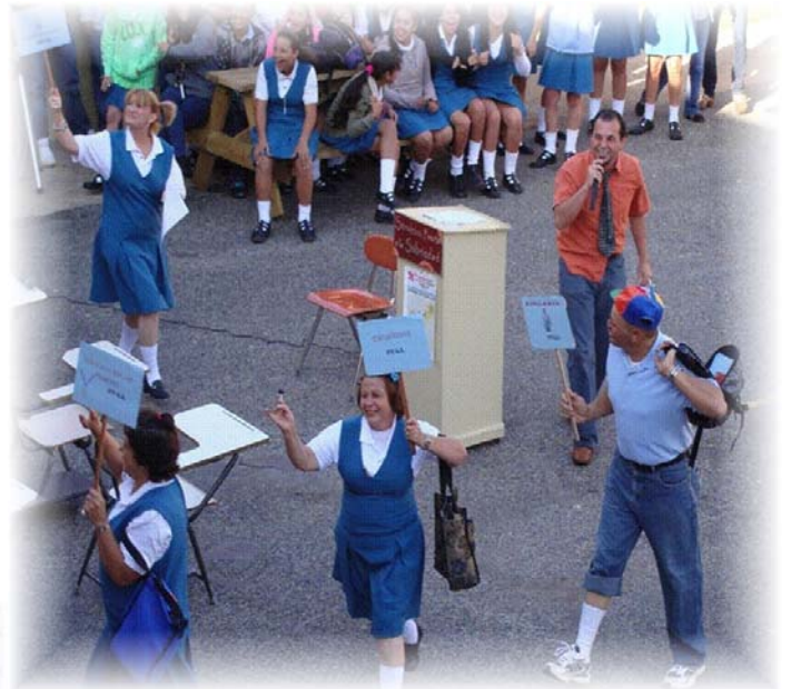
Los maestros y otro personal se vistieron de estudiantes para llevar el mensaje en promoción a las pruebas puertorriqueñas