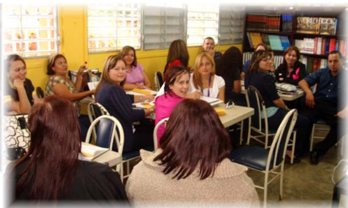
Facultad Escuela Pedro Laboy

El pasado miércoles 25 de marzo de 2009 la Facultad de la escuela Intermedia Pedro Laboy se reunió con el propósito de orientarse sobre las cuentas de padres que ya están disponibles en el Sistema de Información Estudiantil. Se espera que próximamente los padres de esta escuela reciban sus nombres de usuario y contraseñas que les den acceso a los expedientes de sus hijos. También se dedicó un tiempo para que los maestros conocieran el Portal del CITeD y el canal de radiodifusión ya disponible en este portal.