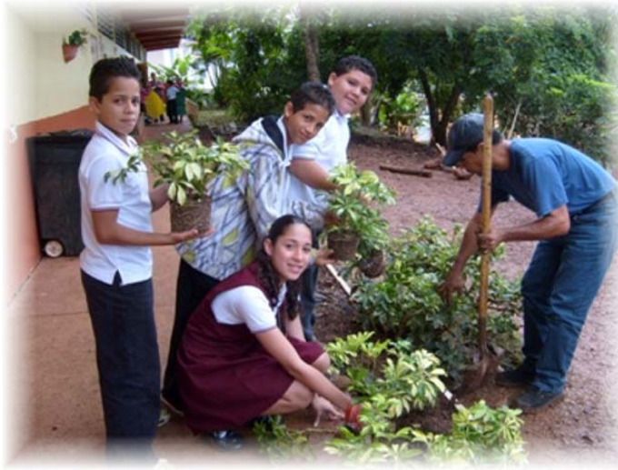
Estudiantes de la Escuela S. U. Federico Degetau trabajando