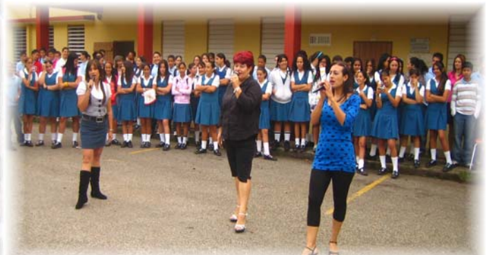
Los maestros también participan haciendo gala de sus dotes artísticas