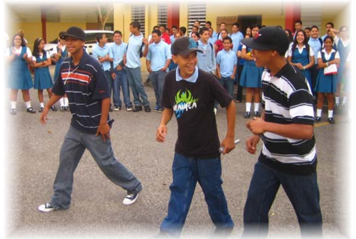
Los estudiantes exponen su talento en un proyecto que tiene como uno de sus objetivos mejorar su desempeño en todos los procesos educativos.

La escuela Intermedia Urbana, José Berríos Berdecia celebra cada lunes de 8:00 a 8:45 de la mañana EL LUNES DE IMPACTO . Actividad dirigida a crear un ambiente de motivación para que los estudiantes realicen una labor de excelencia en las Pruebas Puertorriqueñas. Maestros y estudiantes dan muestras de su talento y creatividad utilizando las bellas artes. Con esta actividad también esperamos lograr un mayor entusiasmo y amor de los estudiantes y toda la comunidad hacia nuestra escuela.