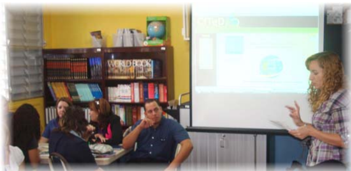
Presentación del Portal del CITeD a facultad de Esc. Pedro Laboy